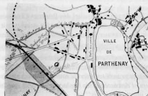
Projet de construction de la gare et des voies d'accès - ADDS - R 57

L'arrivée du chemin de fer en 1882 constitua, comme dans bien d'autres villes françaises un pôle d'attraction indéniable. La ville ne possédait du côté de l'Est qu'un faubourg, celui du Bourg Belay sur lequel nous n'avons guère de renseignements.