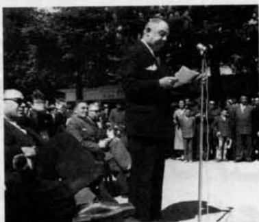
Pendant le discours d'inauguration d'une Foire Exposition

Maire de Parthenay, jusqu'au 8 Mars 1959, il apporta à la défense des intérêts de la cité la même énergie qu'il réservait, depuis sa jeunesse, aux meilleures causes.